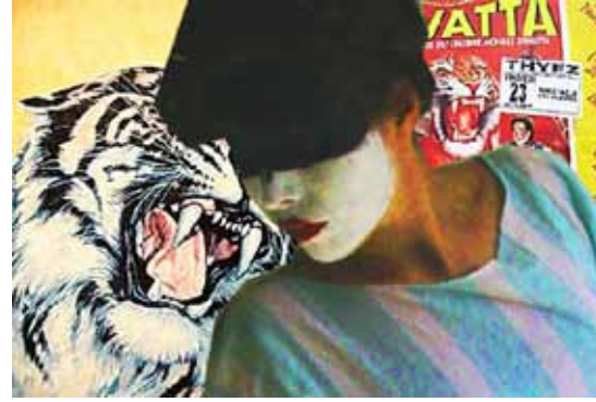
Die Stunde der Wahrheit