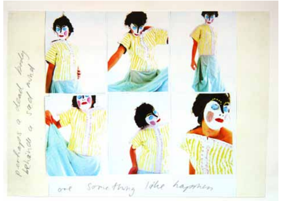
variabel zusammen gesetzt (C9)