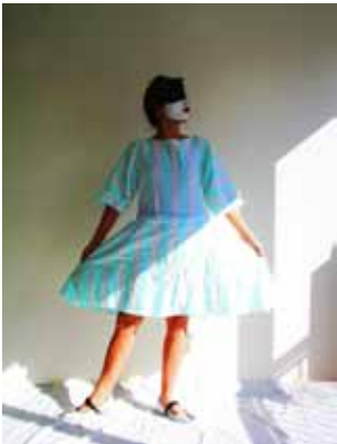
Prima Ballerina III