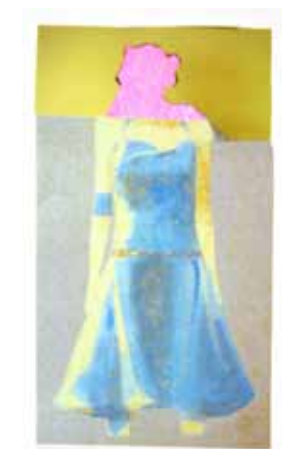
Die Innerei eines Supermodels