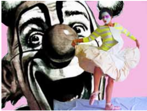
Nur der Wille zählt