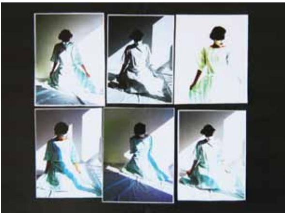
Geishas (variabel zusammen gesetzt)