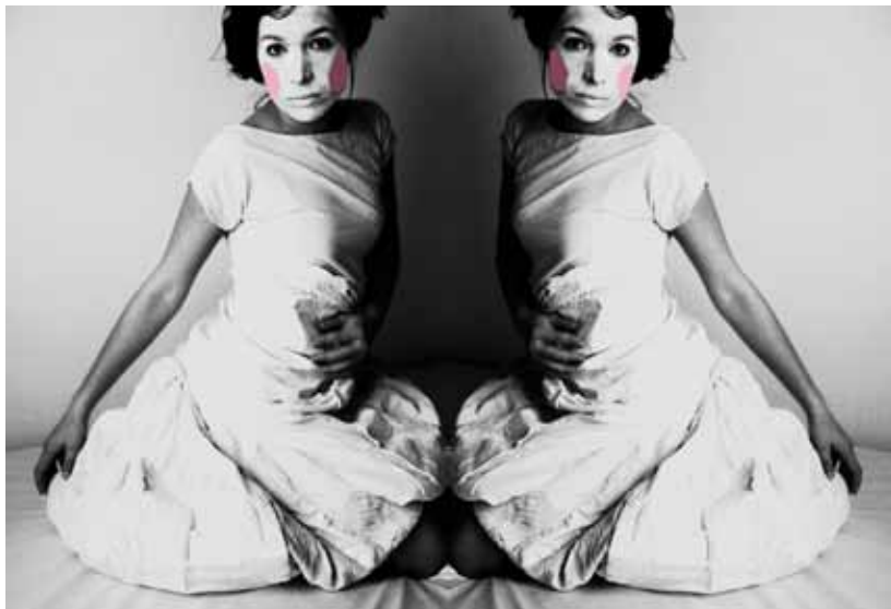
Das symmetrische Supermodel II