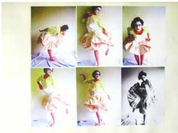
Flamenco/Show (variabel zusammen gesetzt)