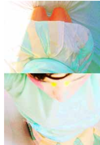
Ein Stück vom Kuchen