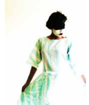
Im Schatten der Leidenschaft