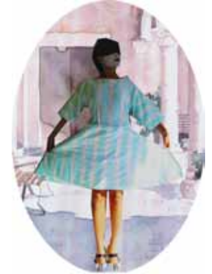
Prima Ballerina II