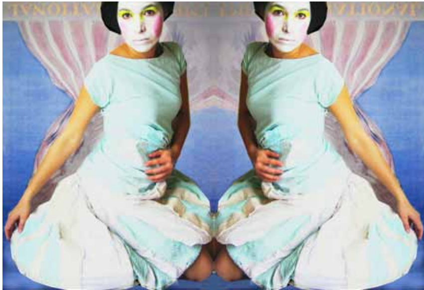
Das symmetrische Supermodel