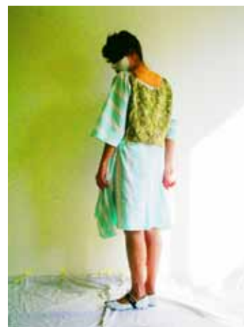
2 Hologrammes dont know what to do