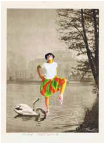
Prima Ballerina / Anstandstanz