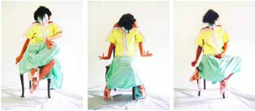
Die Verkrüppelung im Clown (Triptichon)