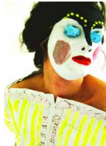
Face the Fake