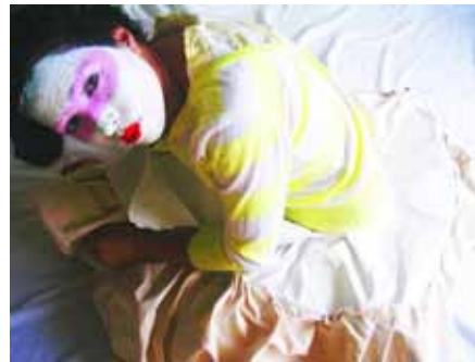
Unter der Bettdecke