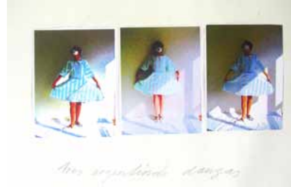
Tres Argentinas danzas