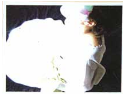
In der Schule