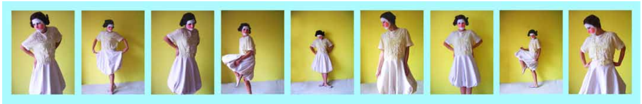
Eine Amseldistel sitzt auf dem Dach (variabel zusammen gesetzt)