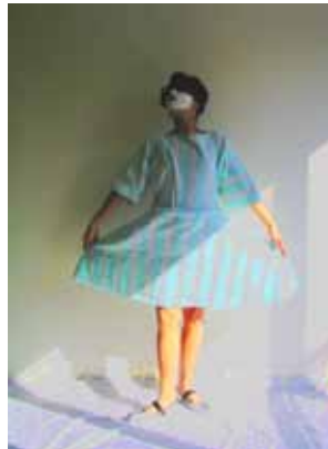
Prima Ballerina IV