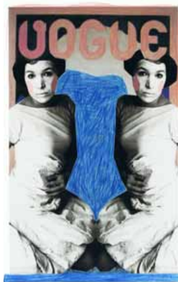
Auf der Modevogue