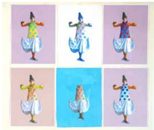
Exhibitionisten (variabel zusammen gesetzt)