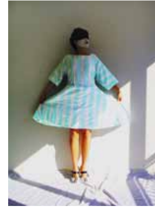
Prima Ballerina V