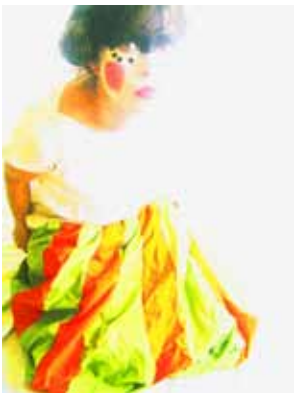
Down in the Spotlight