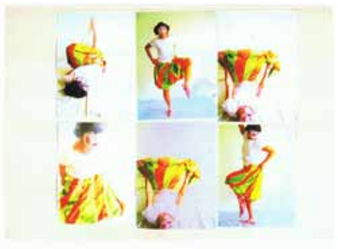
Down in the Spotlight (variabel zusammen gesetzt)