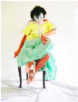
Die Verkrüppelung im Clown